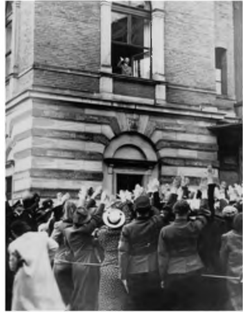
Рис. 3. Адольф Гитлер на фестивале в Байрёйте. 1940

На фотографии (рис. 3) Адольф Гитлер приветствует толпу во время Байрёйтского фестиваля в 1940 г. [17]. Это ежегодный летний фестиваль, на котором исполняются