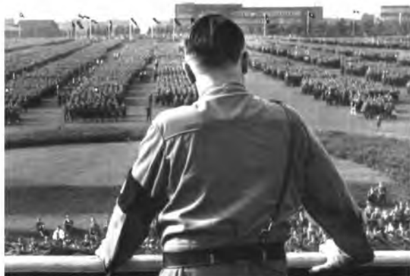
Рис. 4. Адольф Гитлер на балконе Fig. 4. Adolf Hitler on the balcony

людям [19]. Данная фотография опубликована в книге Нила Венборна «XX век: история в фотографиях» со ссылкой на «Hulton Archive».