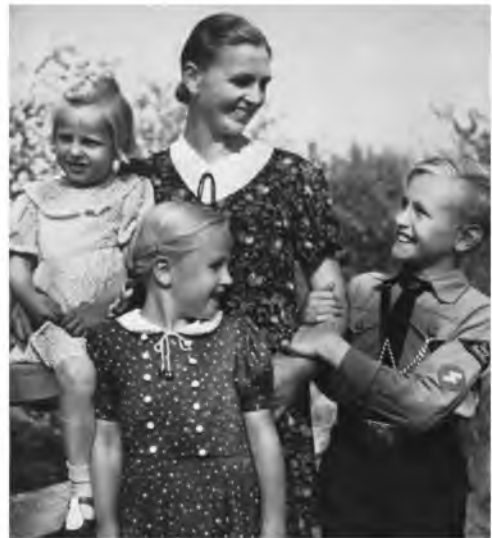
Рис. 1. Фотография в журнале «SS-Leitheft» Fig. 1. Photo in SS-Leitheft Magazine

На первой фотографии (рис. 1) мать, ее дочери и сын в униформе Гитлерюгенда позируют для журнала «SS-Leitheft» [15]. Фото сделано в феврале 1943 г. Примечательно на данной фотографии взаимодействие матери и сына. Она одобрительно улыбается ему, а он держится за ее руку, при этом также улыбаясь матери и глядя ей в глаза. На данном снимке не только прослеживается подтекст важности материнства как такового, но также делается упор на гордость матери сыном, уже исполняющим свой государственный долг.