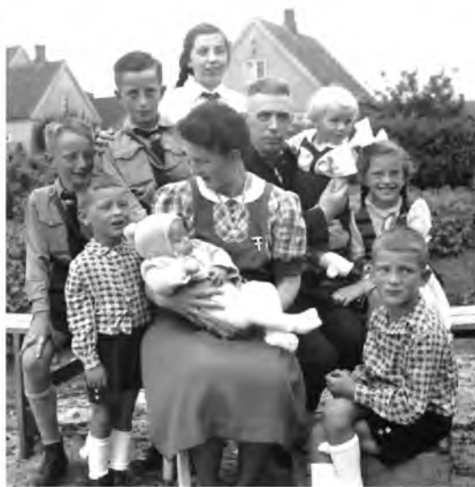
Рис. 2. Фотография из архива «Bildarchiv Preußischer Kulturbesitz»