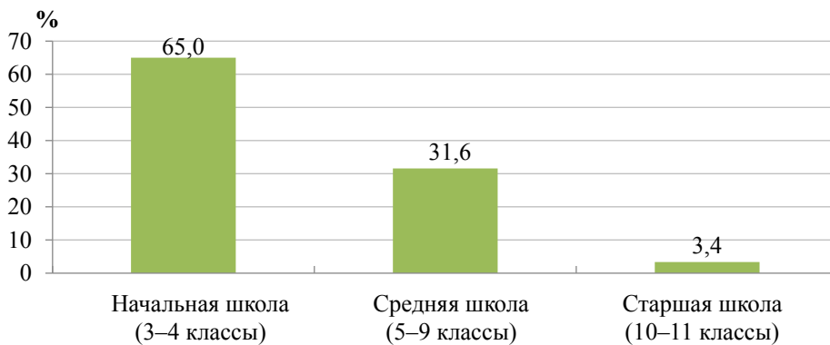
Рис. 2. Принадлежность ребенка к уровню школьного обучения Fig. 2. A child's belonging to the level of schooling

Хотелось бы отметить возрастные особенности детей, находящихся на семейном образовании. Минимальный возраст начала семейного образования связан с возрастом получения школьного образования в нашей стране. Средний возраст ребенка на семейном образовании 9,7 лет. Половина совокупности в возрасте от 8 до 12 лет. Основное количество детей приходится на начальную школу (рис. 2). Это связано с тем, что на начальном этапе обучения родитель без специальной подготовки в состоянии справиться с учебным материалом собственными силами.