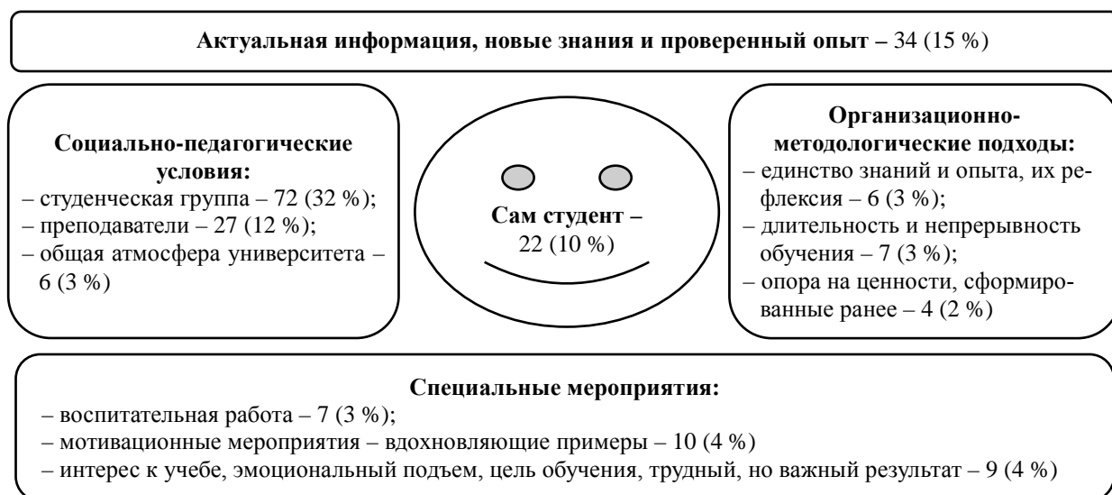
Рис. 2. Условия и факторы, влияющие на повышение роли знаний как триггера формирования системы ценностей Fig. 2. Conditions and factors influencing the increasing role of knowledge as a trigger for the formation of a value system

Такое важное значение непосредственной контактной среды, ее привлекательность и важность в формировании ценностей обусловлена «разницей в системах ценностей жизни» [10, с. 160], что само по себе стимулирует активизацию социального взаимодействия.