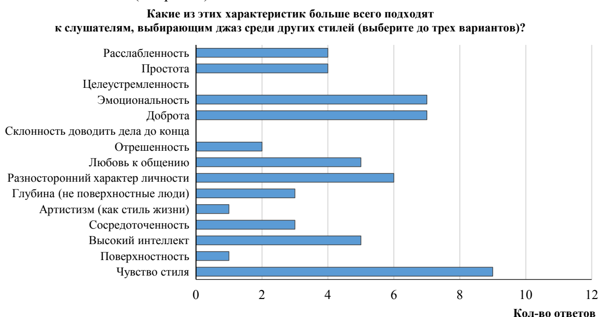
Рис. 2. Характеристики личности слушателей джаза в современном Санкт-Петербурге глазами его исполнителей

Слушатели же джазовой музыки представляются ее исполнителям как люди, также прежде всего обладающие чувством стиля, добрые, эмоциональные, разносторонние, склонные к общению (см. рис. 2).