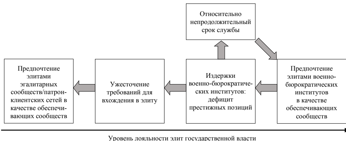
Рис. 1. Фазовая модель динамики лояльности элит государственной власти Fig. 1. Phase model of the dynamics of loyalty of elites to the government

2. Относительно продолжительное пребывание на престижных позициях. Это способствует концентрации власти и влияния, «обрастанию» клиентов «снизу» и покровительством «сверху», обеспечивая возможность передачи ресурсов биологическим или идейным наследникам. Так, вокруг первого секретаря литовской компартии А. Снечкус, занимавшего свой пост с 1940 г. до своей смерти в 1974 г. и пользовавшегося высочайшим авторитетом у союзного руководства (могущественный секретарь ЦК по идеологии М. А. Суслов был его другом), складывается сильная патронажная сеть, куда «чужим» доступ был закрыт, в том числе ставленникам Москвы.