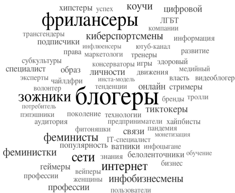
Рис. 2. Облако тегов «Социальные роли и социальные статусы» Fig. 2. Tag cloud «Social roles and social statuses»

Цифровизация стимулирует развитие целого ряда конкретных профессий, которые студентами осознаются в качестве возможных перспектив (рис. 2).