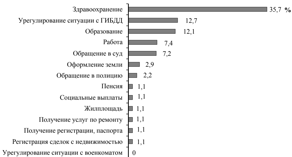
Рис. 1. Сферы коррупционного взаимодействия Fig. 1. Areas of corruption interaction

Наибольший объем коррупционных сделок наблюдается в таких сферах, как здравоохранение (35,7 %), урегулирование ситуаций с ГИБДД (12,7 %) и образование (12,1 %) (рис. 1), что фиксировалось и в предыдущие годы исследований. В остальных случаях давали взятки менее 5 % респондентов. Для выделенных сфер характерна также наиболее высокая доля совершаемых регулярных коррупционных сделок. Если в сферах здравоохранения, образования и урегулирования ситуаций с ГИБДД 4–6 % респондентов давали взятку два и более раз, то в остальных сферах (оформление пенсии, получение паспорта, ремонт жилой площади, регистрация сделок с недвижимостью и т. д.) – не более 0,5 %.